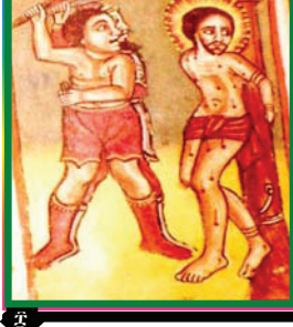
ቀበረዎ ውስተመቃብር ሐዲስ